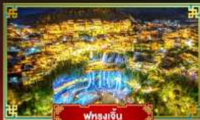
ฟูหลงเจิ่น