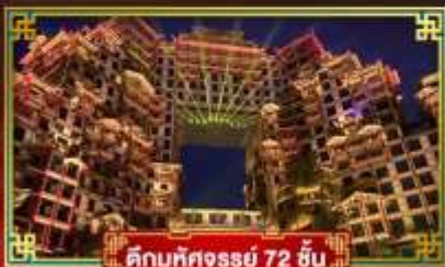
คึกคักศงรรย 72 ชั้น

นั่งกระเช้าขึ้นประตูสวรรค์ เที่ยวหมู่บ้านโบราณ