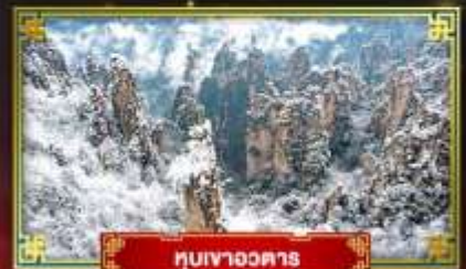
หมู่บ้านอวตาร