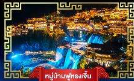
หมู่บ้านฟูรงเจิน