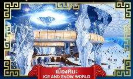
เมืองหิมะ ICE AND SNOW WORLD