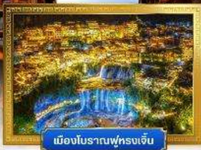
เมืองโบราณฟูหรงเจิ้น