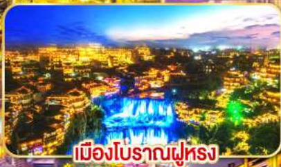
เมืองโบราณฟูหลง