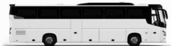
ตัวรถปรับอากาศ 1 ชั้น

ค่าที่พักตามที่ระบุในรายการหรือเทียบเท่าระดับเดียวกับ (ห้องพักละ 2 ท่าน) หากประเภทห้องพักท่านริเวสณาเดิม อาทิ เช่น ริเวสลาห้องพักเป็น TWIN BED หรือ DOUBLE BED ทางบริษัทขอสงวนสิทธิ์ในการปรับประเภทห้องพัก เป็นตามที่โรงแรมมีอยู่ โดยไม่ต้องแจ้งให้ทราบล่วงหน้า