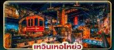
เทียนเหอโฮย๋อ