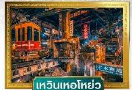
เหวินเหอโฮ่ย