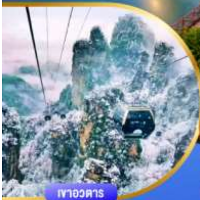
เทาอวดตาร