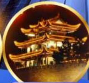
หอคอยทองคำเทียนจิน

📍 หนาวสุดขั้วกับโลกแห่งหิมะ ณ ZHANGJIAJIE SNOW WORLD