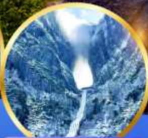
ประติมากรรม หิมะเหมินซาน