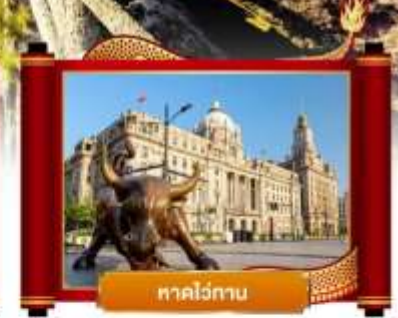
หาดไวกาน