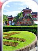
อุทยานหนานซาน