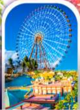
เมืองเฟนตาซี