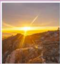
ยอดเขาอวิ๋ฮวาง