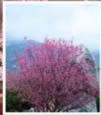
ชมดอกท้อภูเขาไถ่ซาบ