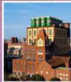
โรงงานเบียร์ซิงเต่า