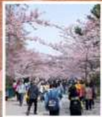
ซากุระจงซาบ