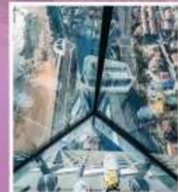
QINGDAO HAITIAN CENTER