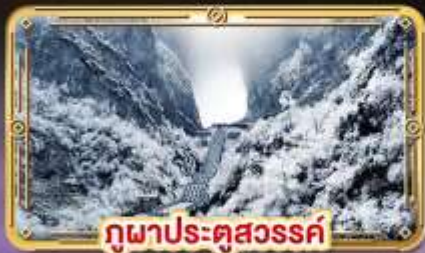
ภูเขาประตูสวรรค์