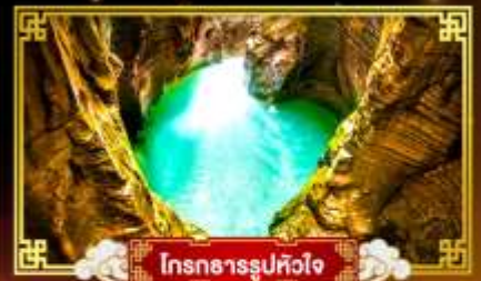
โตรถการรูปหัวใจ