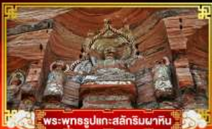
พระพุทธรูปแกะสลักหินผาศิน