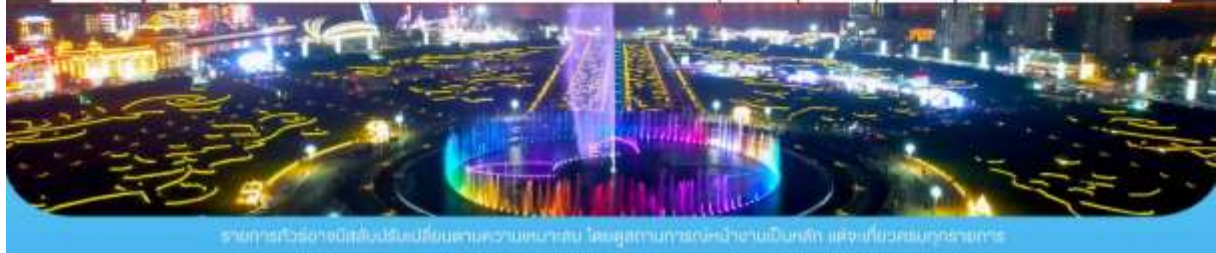
รายการทัวร์อาจเปลี่ยนแปลงได้ตามความเหมาะสม โดยดูสถานการณ์ประจำวันเป็นหลัก แจ้งเที่ยวบินทุกเช้าก่อน