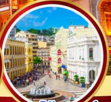
เซนาโดสแควร์