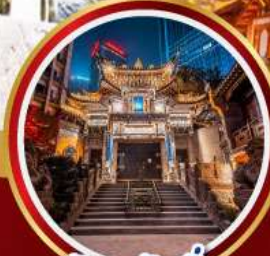
วัดหลัวฮัน