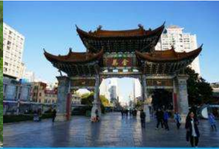
ถนนคนเดินหนานผิงเจีย