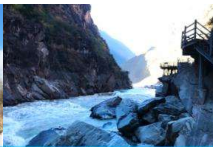
ช่องแคบเสือกระโจน