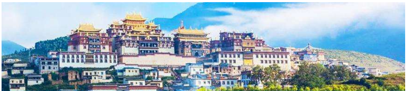
เมืองโบราณแชงกรีล่า