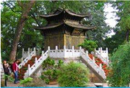
ตำหนักกวางจินเตียน

พักที่ WENDING HOTEL ระดับ 4 ดาวท้องถิ่นหรือเทียบเท่าในเมืองกุ๋งสร่ง