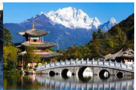
สระน้ำมังกรดำ