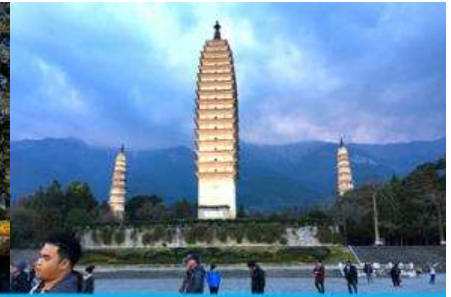
เจดีย์สามองค์

วันที่สอง นครคุนหมิง – รถไฟความเร็วสูงสู่เมืองต้าหลี่ – เมืองโบราณต้าหลี่ – ผ่านชมเจดีย์สามองค์ – เดินทางสู่เมืองแชงกรีล่า-เมืองโบราณแชงกรีล่า