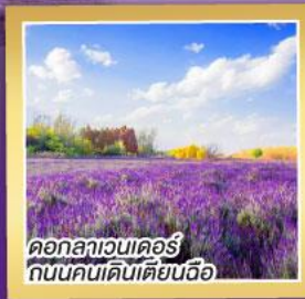
ดอกลาเวนเดอร์ ถนนคนเดินเตียนฉือ