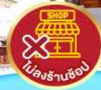
ไม่ลงร้านซื้อ