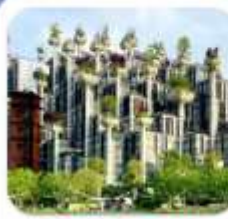
"อาคารพินตันไม้"