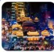
"วัดจิ่งอัน"