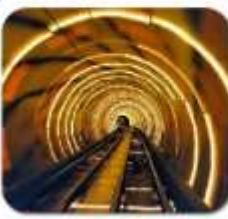
"ลอดอุโมงค์เลเซอร์"

เซี่ยงไฮ้ • ล่องเรือเมืองโบราณจูเจียเจี้ยว • นั่งรถไฟลอดอุโมงค์เลเซอร์ POP MART • วัดจิ่งอัน • อาคารพินตันไม้ • ตลาดรอยปีเงินหวงเมี่ยว อิสระช้อปปิ้งเต็มวัน หรือ จะซื้อตั๋วเที่ยวดิสनीแลนด์