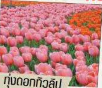
ทุ่งดอกทิวลิป