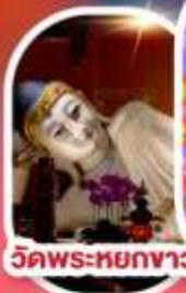
วัดพระหยกขาว