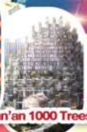
Tian'an 1000 Trees