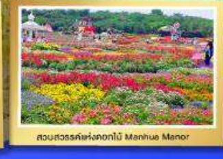
สวนสวรรค์ดอกไม้สีฤดู Manhuo Manor