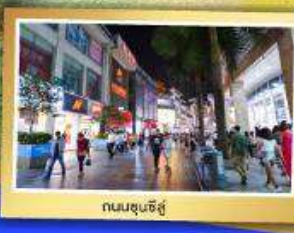
ถนนชุนชี่