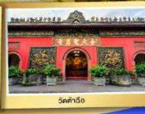
วัดต้าเวี