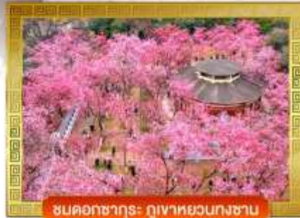
ชมดอกซากุระ ภูเขาหยวนกงซาน