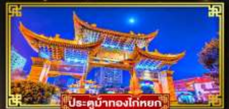
ประตูน้ำทองโก่หยก