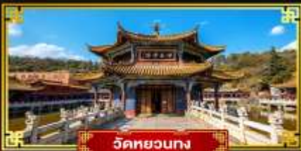
วัดหยวงทง

มหัศจรรย์ "แผ่นดินสีแดงตงชว่น" นั่งกระเช้าขึ้นสู่อยอดภูเขาหิมะเจี๋ยจื่อ