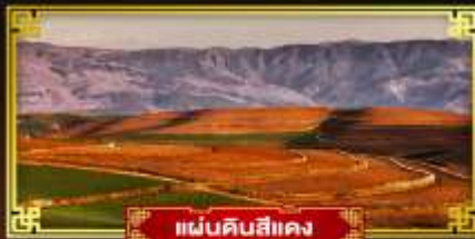
แผ่นดินสีแดง