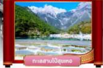
ทะเลสาบไป๋ดูยเทอ