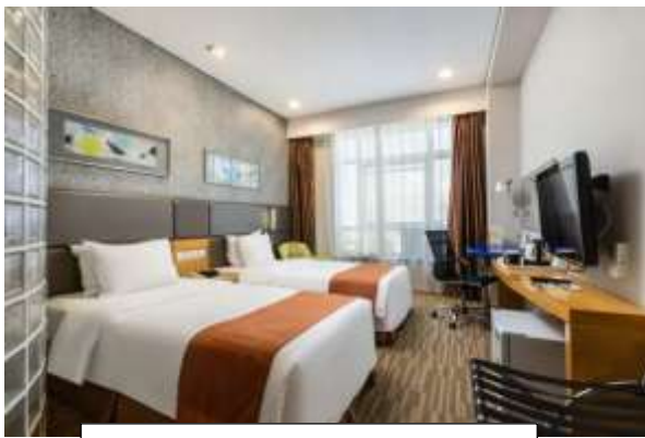
Holiday Inn Express Hotel

ที่พัก Holiday Inn Express Hotel หรือ Jinglin Hotel หรือ เทียบเท่า 4 ดาว