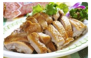
รูปเพื่อประกอบเท่านั้น

เป็ดเจี๋ยจี หรือที่เรียกกันว่า "ฟานย่า" มีกระหม่อมสีแดง ครีบเหลือง และขนสีดำและสีขาว เนื่องจากวิธีการให้อาหารที่ไม่เหมือนใครในพื้นที่เจี๋ยจีของไห่หล่า เป็ดจึงมีหน้าอกใหญ่ หนังบาง กระดูกอ่อน และเนื้อนุ่ม มีไขมันแต่ไม่มัน สามารถลองชิมได้ในร้านอาหารเกือบทุกแห่งในชานย่า