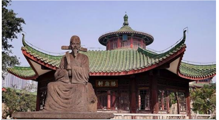
https://www.chinadiscovery.com/hainan/haikou/things-to-do.html Hairui Tomb © 海口市旅行社协会/ishar.ifeng

ถึงเมืองไห่โข่ว นำชม สุสานไห่รุ่ย (เป่าบุ๋นจิ้นไห่หล่า) Hairui Tomb 海瑞墓 ไห่รุ่ย (ค.ศ. 1514 ~ ค.ศ. 1587) เจ้าหน้าที่ผู้ซื่อสัตย์และไม่หวัหริต สุสานแห่งนี้สร้างขึ้นครั้งแรกในปี ค.ศ. 1589 ในสมัยราชวงศ์หมิง (ค.ศ. 1368-1644) โครงสร้างบางส่วนในสวนสุสานยังคงสภาพสมบูรณ์ ด้วยพื้นที่กว่า 4,000 ตารางเมตร การจัดวางสุสานได้รับการออกแบบตามระดับของตำแหน่งทางการในสมัยนั้น สถาปัตยกรรมและอาคารในสุสานไห่รุ่ย มีความเคร่งขรึมและดั้งเดิม มีซุ้มประตูหินสูงตระหง่านที่ประตูหน้า มีจารึกแนวอนว่า "ความชอบธรรมของกวางตุ้งตะวันออก (粤东正气)" ทางเดินยาวกว่า 100 เมตร ที่นำไปสู่สุสาน ปูด้วยหินแกรนิต มีการแกะสลักหิน เช่น รูปคนหิน แกะหิน ม้าหิน สิงโตหิน เต่าหินที่ยืนอยู่ทั้งสองข้าง ปัจจุบันสุสานแห่งนี้ได้รับการจัดอันดับให้เป็นมรดกทางวัฒนธรรมที่สำคัญของมณฑลไห่หล่า