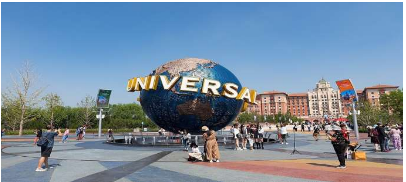
ที่พัก LeafIN HOTEL BEIJING หรือเทียบเท่า

อิสระอาหารกลางวัน และค่า ไม่รวมอยู่ในรายการ