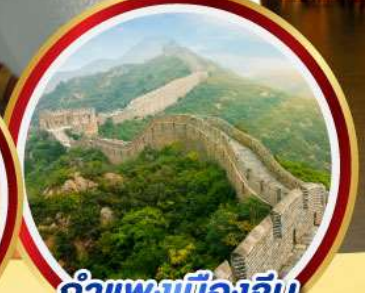
กำแพงเมืองจีน ด่านจวิ๊ยกทวน