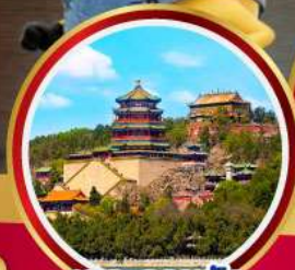
พระราชวัง ฤดูร้อน