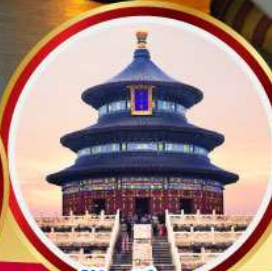
หอฟ้าเทียนถาน