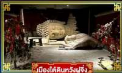
เมืองใต้ดินหวงผู่จิ้ง

“กำแพงหินลี่”...สิ่งมหัศจรรย์ของโลก พระราชวังต้องห้าม อดีตพระราชวังหลวงสุดยิ่งใหญ่