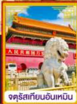
จัตุรัสเทียนอันเหมิน