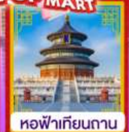
หอฟ้าเทียนถาน