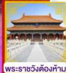
พระราชวังต้องห้าม