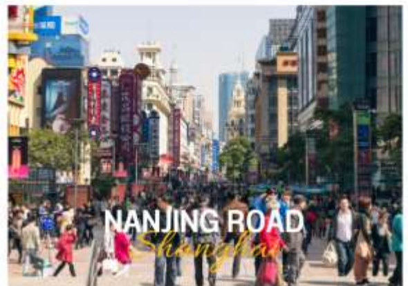
NANJING ROAD Shanghai

ถนนหนานจิง หรือที่รู้จักกันอีกชื่อว่า นานกิง ย่านช้อปปิ้งที่เก่าแก่และมีชื่อเสียงที่สุดในเซี่ยงไฮ้เลยในตอนเย็นจะเป็นช่วงที่ร้านค้าและบาร์ต่างๆกำลังคึกคักมีนักดนตรีริมถนนเต็มไปด้วยแสงสีเสียงเหมาะกับการเดินเล่นหรือนั่งรถรางชมบรรยากาศรอบๆฝั่งตะวันตกจะมีห้างสรรพสินค้าใหญ่ๆสลับกับร้านแบบจีนดั้งเดิมอยู่ตลอดสองข้างทาง