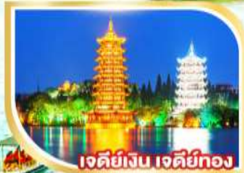
เจดีย์เงิน เจดีย์ทอง