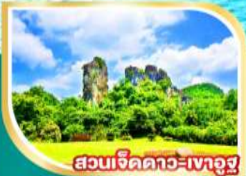
สวนเจ็ดดาว-เงาอู๋