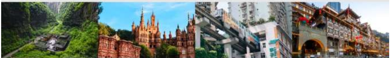
อุทยานแห่งชาติหลุมฟ้า 3 สะพานสวรรค์ Hua Sheng Yuan Dream Castle รถไฟฟ้าทะลุติ๊ก หงหยาดิง

*ทางบริษัทฯ ขอสงวนสิทธิ์ในการสับเปลี่ยนโปรแกรมทัวร์ตามความเหมาะสมขึ้นอยู่กับสถานการณ์การทำงาน โดยค่าใช้จ่ายที่ผลประโยชน์ของลูกค้าเป็นสำคัญ