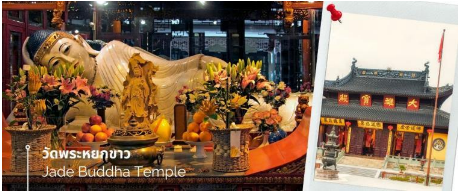
วัดพระหยกขาว Jade Buddha Temple

หลังรับประทานอาหารเช้า นำท่านชม วัดพระหยกขาว Jade Buddha Temple เป็นวัดที่มีชื่อเสียงมากที่สุดในเมืองเซี่ยงไฮ้ ซึ่งเป็นที่รู้จักจากพระพุทธรูปสององค์ที่สร้างขึ้นจากหยกทั้งแท่ง องค์พระพุทธรูปปางนั่งมีความสูง 190 เซนติเมตร และ หุ้มด้วยเพชรพลอย หิน มโนรา และ มรกต และองค์พระพุทธรูปปางไสยาสน์ มีความยาว 96 เซนติเมตร นอนเอียงด้านขวาและหนุนพระเศียรด้วยพระหัตถ์ขวา ถือเป็นวัดที่มีทั้งชาวจีนและนักท่องเที่ยวเดินทางมาสักการะบูชา