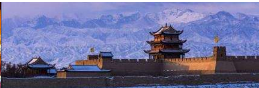
ด่านเจี๋ยวิ้วกวน

วันที่สาม เมืองจางเยี่ย – วัดพระใหญ่เมืองจางเยี่ย –เดินทางสู่เมืองเจี๋ยวิ้วกวน-ด่านเจี๋ยวิ้วกวน