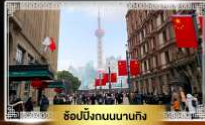
ช้อปปิ้งถนนนานกิง