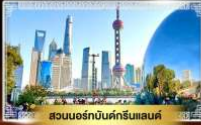
สวนนอร์มัลด์กรีนแลนด์