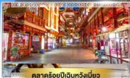
ตลาดร้อยปีเงินหวังเมี่ยว