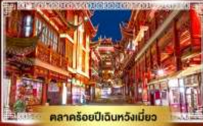
ตลาดร้อยปีเดินห้างเมี่ยว

📅 เดินทาง : 10-15 เม.ย. | 12-17 เม.ย. 68