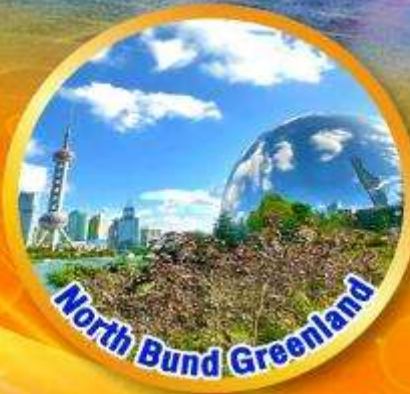
North Bund Greenland