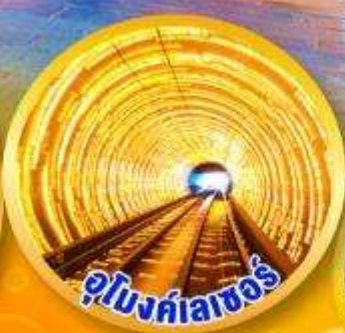
อุโมงค์แสงซอร์