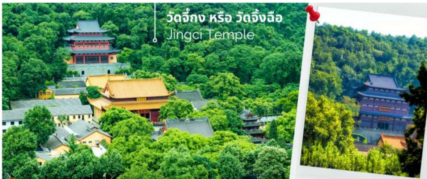
วัดจิ้งก หรือ วัดจิ้งจิว Jingci Temple

สวนชาหลงจิ่ง และถ่ายรูปกับสวนใบชาหลงจิ่ง และจิบชา ก่อนนำท่านไปซื้อป๊ิง หังโจว เอาท์เลต ที่มีแบรนด์ดังมากมาย ทั้งแบรนด์จีน แบรินด์ฮ่องกง หรือแบรนด์อินเตอร์มากมาย เป็นจุดให้ท่านได้ละลายเงินหยวนได้อย่าง