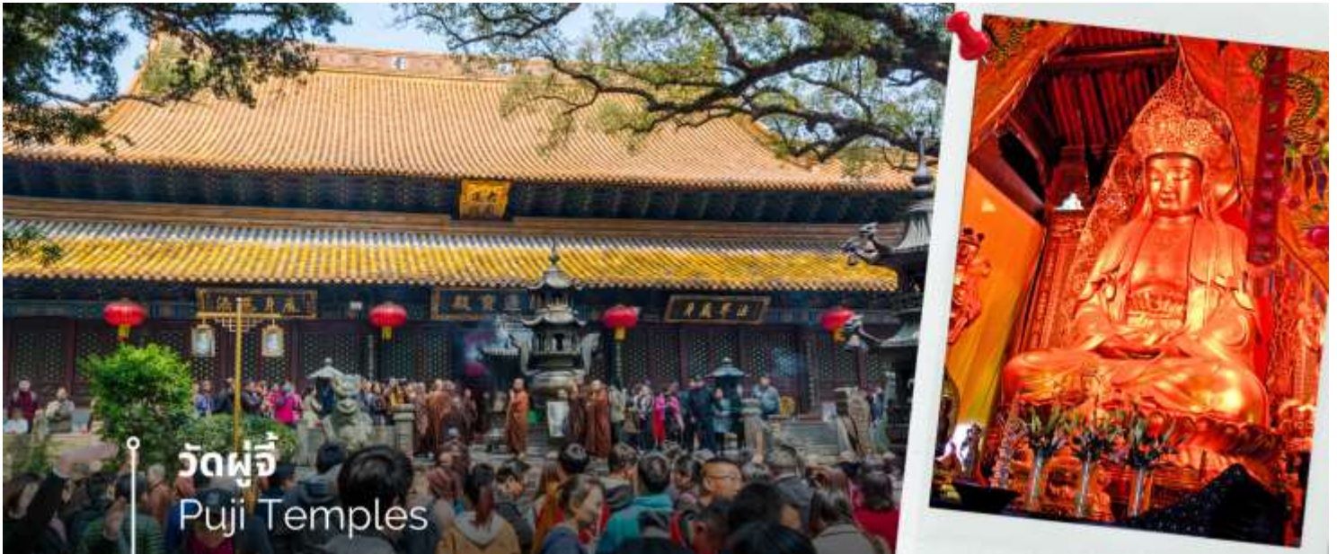
วัดผู้จี Puji Temples

นำท่านสู่ วัดผู้จี วัดในตำนานที่ควรมาเป็นอย่างยิ่ง โดยไฮไลท์ของวัดนี้คือ องค์พระโพธิสัตว์ที่มีเทพลักษณะเป็นชาย เป็นองค์ที่ชาวจีนทั่วโลกให้ความเลื่อมใสศรัทธาสูงสุด ซึ่งวัดผู้จีเนี่ย เป็นวัดใหญ่ที่สุดบนเกาะที่มีประวัติเก่าแก่นับพันปี แต่เดิมเนี่ยเป็นวัดเล็ก แต่ผ่านร้อนผ่านหนาวมา ตั้งแต่ยุคราชวงศ์ซ่ง หยวน หมิง และชิง จนกระทั่งได้รับพระราชทานนาม “ผู้จี” จากจักรพรรดิคังซีแห่งราชวงศ์ชิง ส่วนในรัชสมัยของจักรพรรดิหย่งเจิ้งก็ได้รับการบูรณะครั้งใหญ่จน