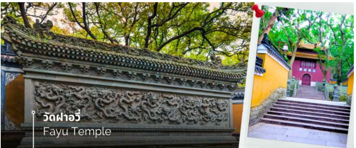
วัดผาอวี Fayu Temple

หลังอาหารนำท่านนมัสการองค์พระโพธิสัตว์ เจ้าแม่กวนอิมไม่ยอมไป วัดไผ่สีม่วง อีกหนึ่งวัดที่ตั้งอยู่บนเกาะผู้โถวซาน ซึ่งที่นี่ได้รับสมญานามว่า “เกาะพระโพธิสัตว์” เพราะเป็นวัดเล็กๆ ที่อยู่ติดกับทะเล สาเหตุที่เรียกว่าวัดไผ่ม่วง เพราะว่าบริเวณนั้นมีต้นไผ่สีม่วงขึ้นเยอะ และความพิเศษอีกอย่างหนึ่งคือ ต้นไผ่สีม่วงจะมีในเกาะแห่งนี้ที่เดียว สำหรับไฮไลท์เด็ดของที่นี่คือ “เจ้าแม่กวนอิมไม่ยอมไป” ซึ่งวัดนี้มีประวัติมาอย่างยาวนาน ตั้งแต่สมัยราชวงศ์ถัง (ค.ศ.961) ซึ่งเป็นยุคที่พุทธศาสนามีความเจริญรุ่งเรืองในแผ่นดินจีน พระโพธิสัตว์ศักดิ์สิทธิ์องค์นี้ไม่ยอมรับอัญเชิญไปประดิษฐานที่ญี่ปุ่นตามการอัญเชิญของหลวงพ่อยุ้ยเอ้อ ภิกษุชาวญี่ปุ่นที่มาศึกษาพระธรรม องค์ท่านจึงได้ดลบันดาล