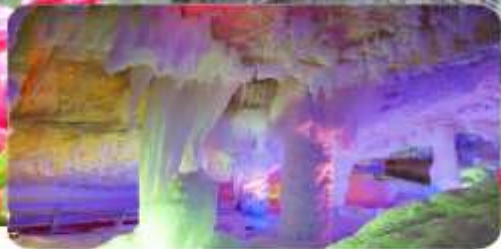
ถ้ำน้ำแข็งหยิงเป่ย์