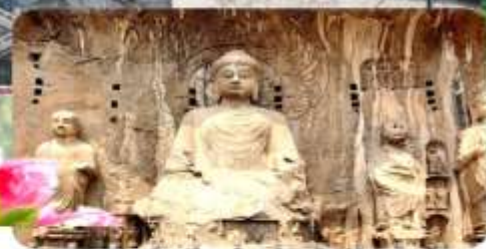
ถ้ำผาหลงเหมิน

เมนูพิเศษ เกี่ยวซีอาน เปิดอย่างซีอาน ซาบูไม้อื่น 7 วัน 5 คืน เดินทาง : 13-19 เมษายน 68