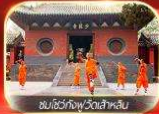
ชมโชว์กังฟูวัดเส้าหลิน