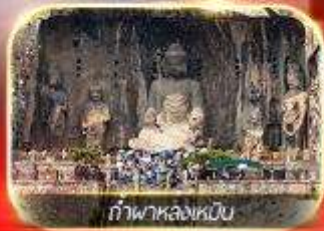
ถ้ำพาล่งหลิน