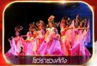
โชว์ราชวงศ์ถัง

สัมผัสความยิ่งใหญ่อลังการกองทัพจีนสี่ฮ่องเต้ นั่งรถไฟความเร็วสูงทะลุเมืองโบราณ ย้อนตำนานประวัติศาสตร์จีน