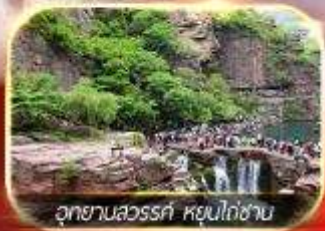
อุทยานลั่วหลู่ หุบเขาเขียว