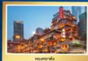
ตึกชาตัง