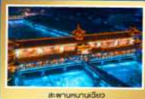
สปาบนภูเขาเจียง