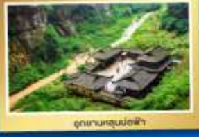
อุทยานหลุมฝังศพ