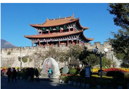
เมืองโบราณต้าลี่

18.26 น. เดินทางถึงเมืองต้าลี่ นำท่านสู่ภัตตาคารในเมืองต้าลี่ ค่ำ รับประทานอาหารค่ำ ณ ภัตตาคาร หลังอาหารนำท่านเข้าสู่ที่พัก พักที่ DALI ZHUANG HOTEL ระดับ 4 ดาวหรือเทียบเท่าในเมืองต้าลี่