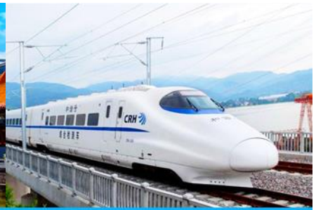
บั้งรถไฟความเร็วสูง