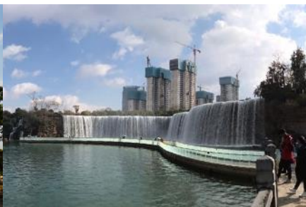
สวนน้ำตก Kunming Waterfall Park