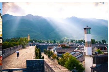
หมู่บ้านซีโจว(หมู่บ้านชาป๋อ)