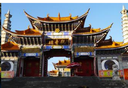
วัดเจ้าแม่กวนอิมเปลงกาย