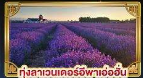
ทุ่งลาเวนเดอร์อิฟาอ้อฮัน