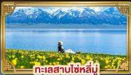
ทะเลสาบไซหลู่