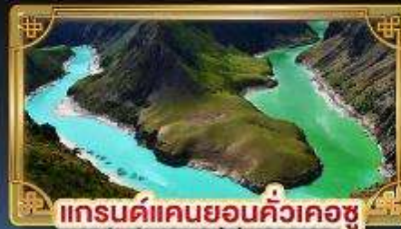
แกรนด์แคนยอนคิ้วเคอซู