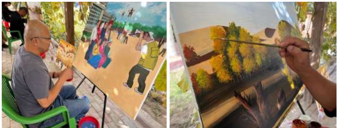
A farmer painter creates a Daolang-style painting in northwest China's Xinjiang Uygur Autonomous Region.

นำชมหอจิตรกรรมภาพวาดชาวนาเผาดาวหลัง ที่ Daolang Painting Village ภาพวาดดาวหลังนั้นใกล้เคียงกับชีวิตประจำวันของชาวนา ผสมผสานจินตนาการและความคิดสร้างสรรค์เข้าด้วยกัน ทำให้งานศิลปะได้รับความนิยมอย่างกว้างขวางทั่วโลก ไม่กี่ปีที่ผ่านมา มีการจัดแสดงภาพวาด Daolang มากกว่า 2,800 ชิ้น ทั้งในและต่างประเทศ และมีผลงานกว่า 1,000 ชิ้น ได้รับการรวบรวมโดยหอจิตรกรรมที่มีชื่อเสียงระดับโลก ปัจจุบันตำบลคูมูคูซาเออร์ Kumkusar มีจิตรกรชาวไร่ที่มีชื่อเสียงมากกว่า 300 คน และมีสมัครเล่นอีก 800 คน จิตรกรพื้นบ้านชาวนาดาวหลังสามารถแสดงออกทางศิลปะได้อย่างเสรี ไม่ยึดติดกับกฎเกณฑ์ทั่วไป ไม่ถูกจำกัดด้วยโครงสร้างภาพจึงมีการถ่ายทอดด้วยมุมมองที่เฉียบคม ด้วยมุมมองที่ขัดแย้งในอารมณ์ขัน ด้วยการบรรยายอารมณ์ที่เกินจริง ถือเป็นลักษณะพิเศษทางศิลปะของจิตรกร "Dao Lang Peasant Paintings"