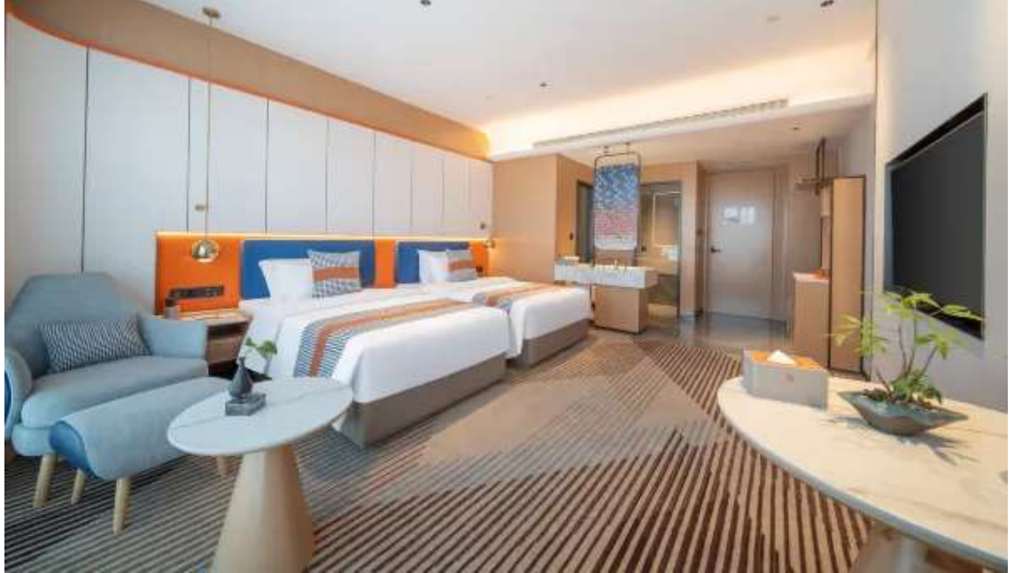
Aksu: HUATUI HOTEL 阿克苏华瑞大酒店 +86-997-2719999 阿克苏市南城街道上海路 60 号 开业: เปิดบริการปี 2023