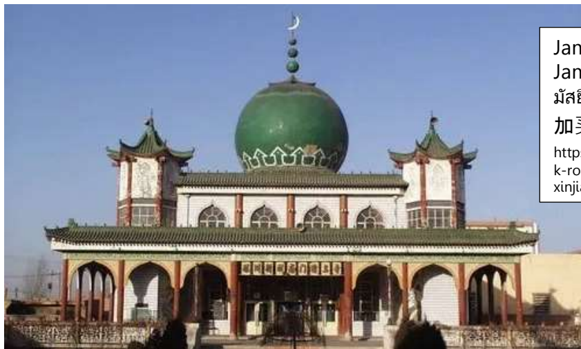
Jami Mosque Jama Mosque มัสยิดใหญ่จามา “ชิงเจินเฉียว” 加买清真寺 https://www.silkroadtravel.com/silk-road-group-tours/xian-gansu-xinjiang.html

นำท่านผ่านชม Jama Mosque 加买清真寺 มัสยิดใหญ่จามา “ชิงเจินเฉียว” เป็นมัสยิดหลักในโหตัน หรือ เหอเถียน ซินเจียง ประเทศจีน สร้างขึ้นในปี พ.ศ. 2413 และผู้อุปถัมภ์คือ Habibullah Khan มัสยิดตั้งอยู่ใจกลางเมืองเหอเถียน สัมผัสวิถีชีวิตของชาว Hotan ที่ Hotan Grand Bazaar ตั้งอยู่ทางตะวันออกเฉียงเหนือของเมือง Hotan มีสินค้าโภคภัณฑ์ และมีตลาดสำหรับวัสดุทางการแพทย์ของชาวอุยกูร์ แดง และผลไม้ ปัจจุบันการผลิตทางการเกษตร ปศุสัตว์ สินค้ามือสอง ฯลฯ