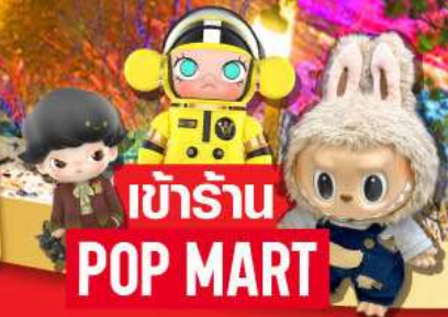
เข้าร้าน POP MART