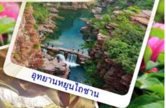
อุทยานหยุนโถซาน