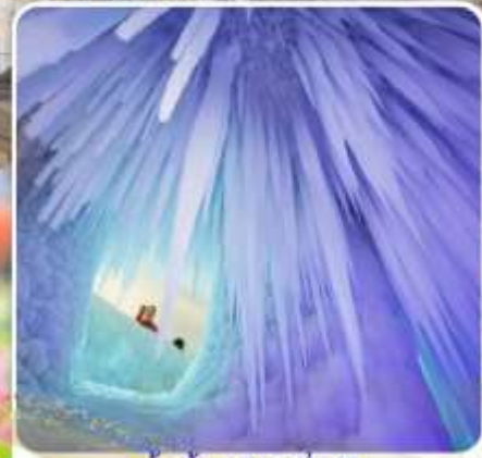
ถ้ำน้ำแข็งหมื่นปี