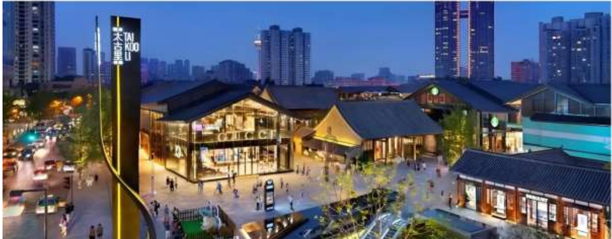
นำท่านเดินทางสู่ ถนนคนเดินไท่กู่หลี่ มีช้อปปิ้งคอมเพล็กซ์ ร้านอาหารสรรพสินค้าใต้ดิน โรงภาพยนตร์จัดรัส และโรงแรมหรู ทุกท่านจะได้สัมผัสความทันสมัยและทำความเก่าแก่ ของวัฒนธรรมจีน ที่ผสมผสานอย่างลงตัว

🍴 รับประทานอาหารกลางวัน มื้อที่ 12 #ยานยนต์ส่วนบุคคล ✓