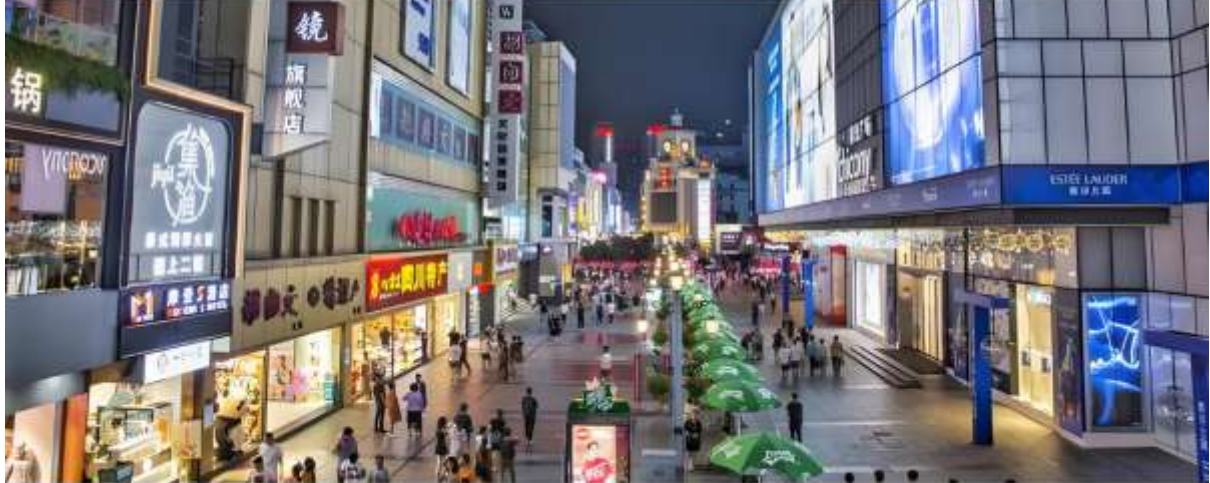
นำท่านสู่แหล่งช้อปปิ้ง ถนนชุนซีลู่ เป็นถนนคนเดินที่ใหญ่และทันสมัยที่สุดในเมืองเจิ้งตู หรือเป็นย่านวัยรุ่น เต็มไปด้วยร้านค้าและแหล่งช้อปปิ้ง รวมไปถึงร้านอาหารต่าง ๆ มากมาย แหล่งช้อปปิ้ง ร้านช้อปปิ้งหรูหลายมากมาย