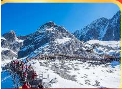
ภูเขาศิมะมิงกรหยก