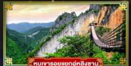
หุบเขารอยแยกอู่ทงซาง