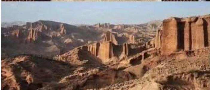
เมืองฝีคารามเย่

เช้า ๑๑ รับประทานอาหารเช้า ณ ห้องอาหารโรงแรม