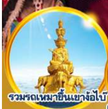
รวมรถเหมาขึ้นเขาอ้อไบ๊