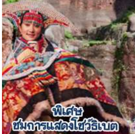
พิเศษ ชมการแสดงโชว์ริบเบต